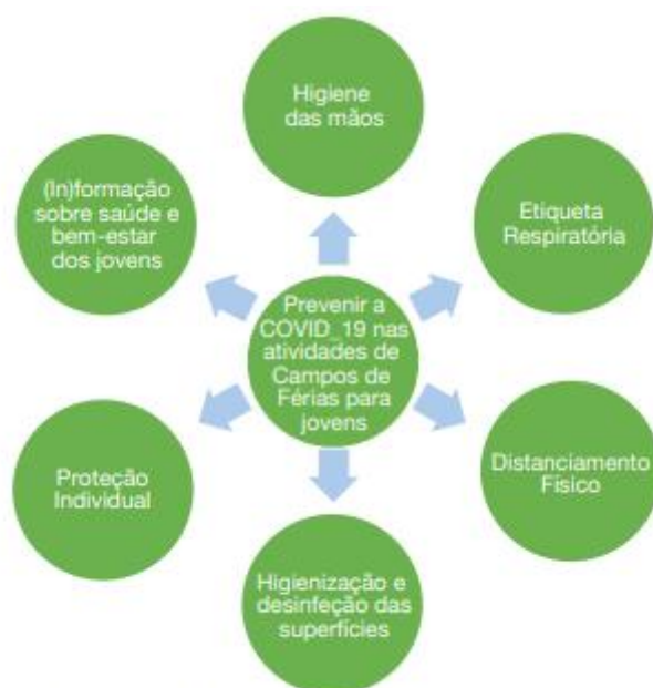
Figura 2 - Medidas de Prevenção da COVID-19

Por esta razão, as entidades organizadoras devem assegurar que os funcionários, colaboradores e participantes estão empenhados no seu cumprimento, dispõem de informação adequada para o fazer, e de material de suporte e comunicação.